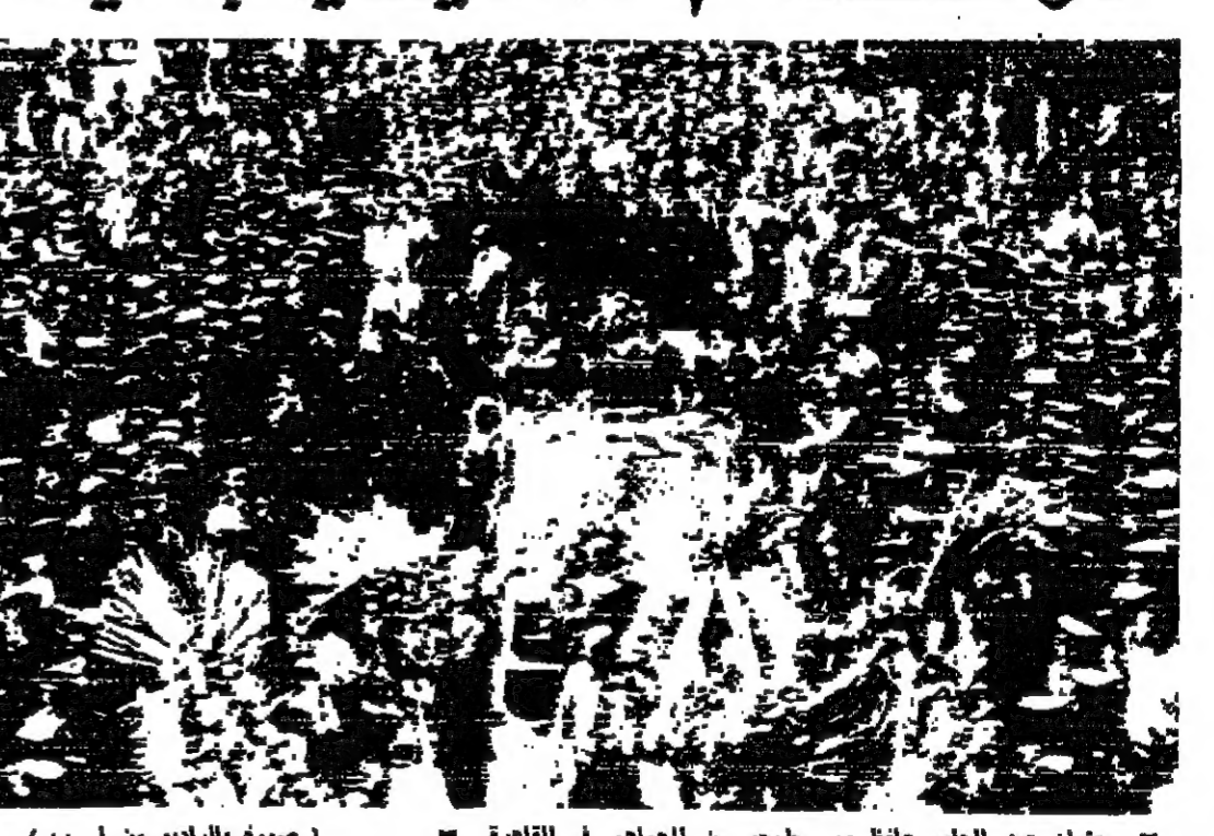
جثمان عبد الحليم حافظ وسط طير من الجماهير في القاهرة.